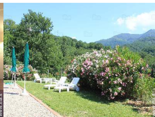
vista sulla piscina