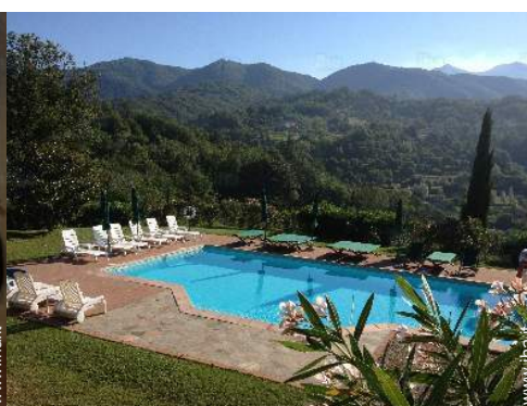
vista sulla piscina