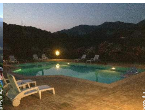
vista sulla piscina