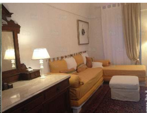
camera per ragazzi