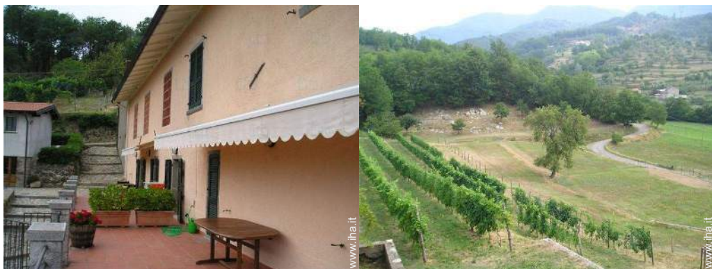
vista sui vigneti