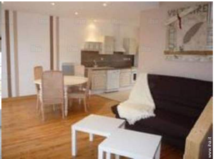
vista dal soggiorno