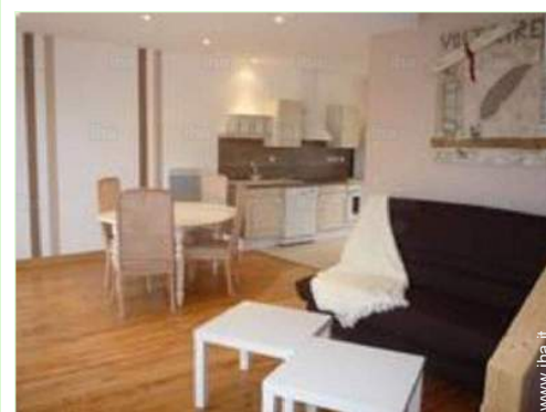
vista dal soggiorno

Campo da tennis pubblico Percorso di golf 18 buche Scogliera Scalo di alaggio per la barca