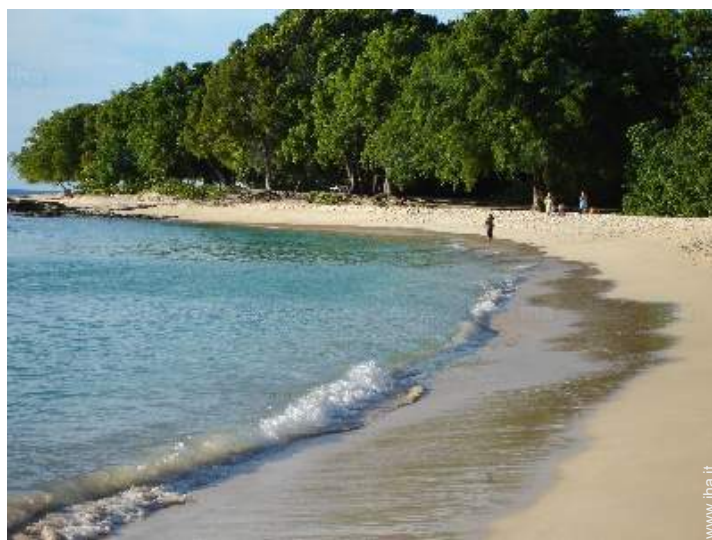
luogo per bagnarsi