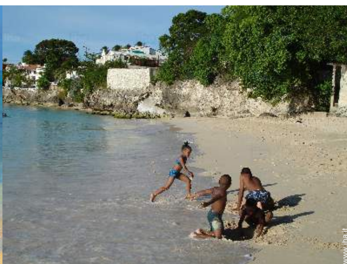
luogo per bagnarsi