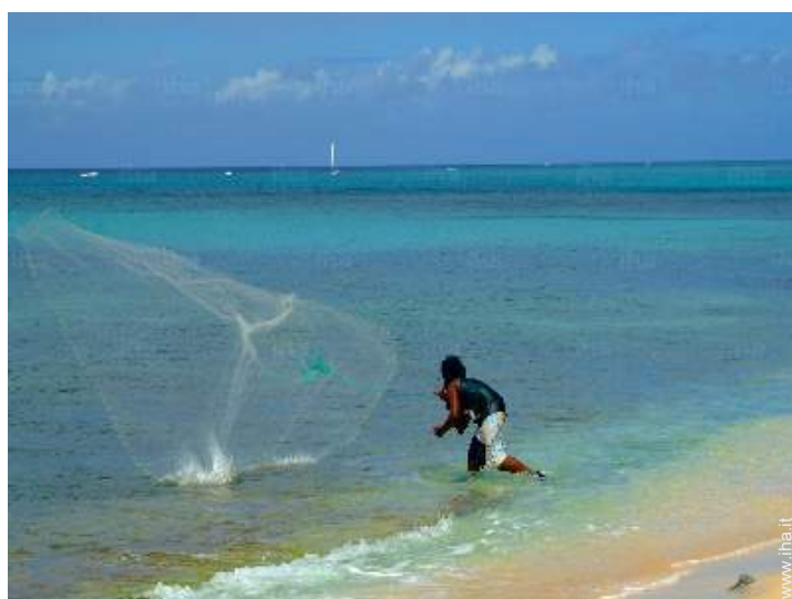
attività balneari nelle vicinanze