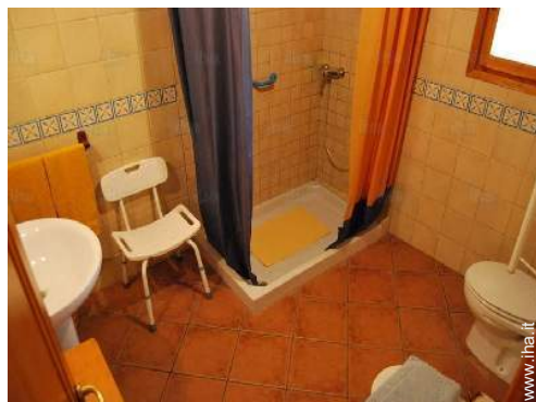
stanza di servizio