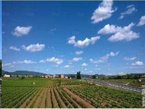
vista sui vigneti