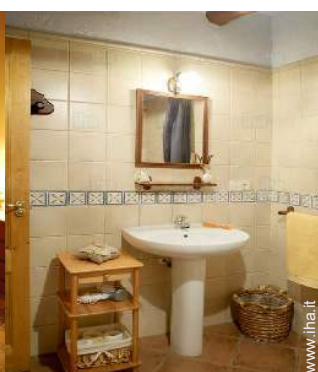
stanza di servizio