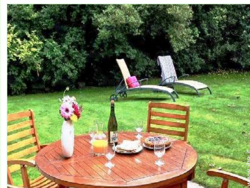
salotto da giardino

Panetteria 4km Traiteur 4km Supermercato 7,5km Salone di coiffure 4km Ufficio postale 4km Banca 4km Distributore automatico di biglietti 4km Farmacia 4km Medico 4km Infermiera 4km Ospedale 15km