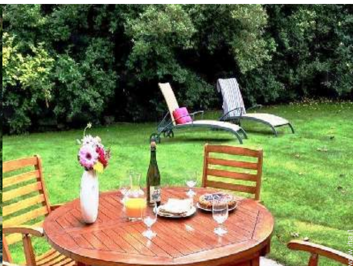
salotto da giardino