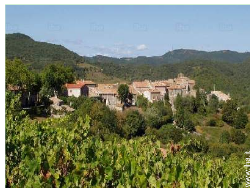
attività di volo nelle vicinanze