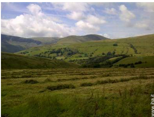
vista sulla campagna