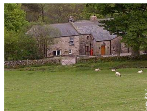
vista sui campi agricoli

Villaggio centro 5km Centro città 10km Noleggio biciclette/mountain bike 10km Panetteria 10km Negozi tipici 10km Supermercato 10km Salone di coiffure 10km Ufficio postale 10km Banca 10km Distributore automatico di biglietti 10km Farmacia 10km Medico 10km Ospedale 30km Ambulatorio 10km