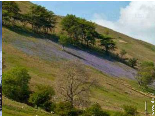
vista dal soggiorno