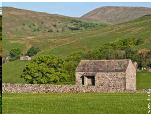
vista dal giardino/parco