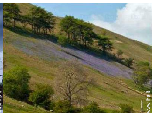
vista dal soggiorno