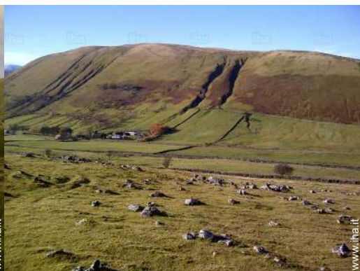
vista sulla campagna