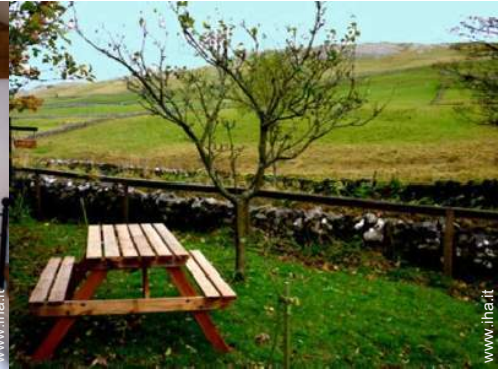
vista dal giardino/parco