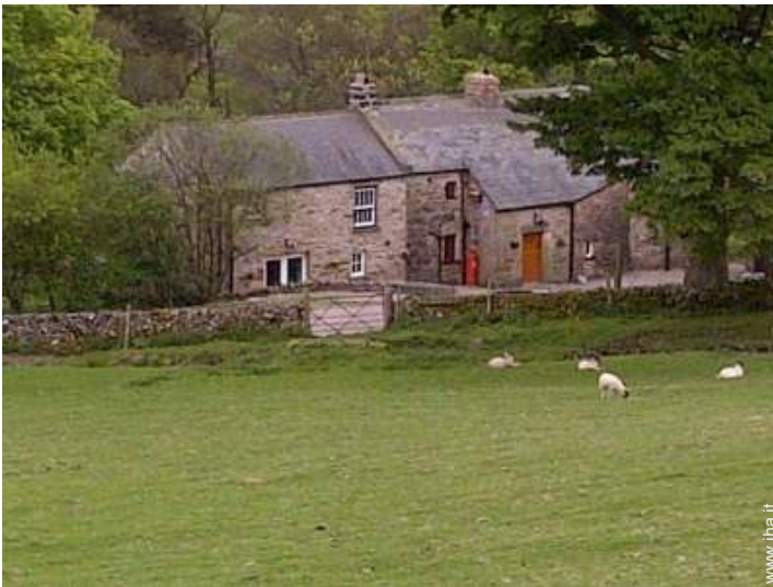
vista sui campi agricoli