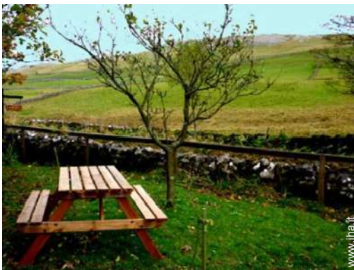
vista dal giardino/parco