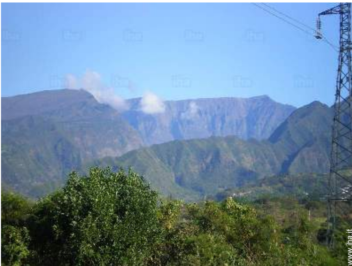
vista sulla montagna