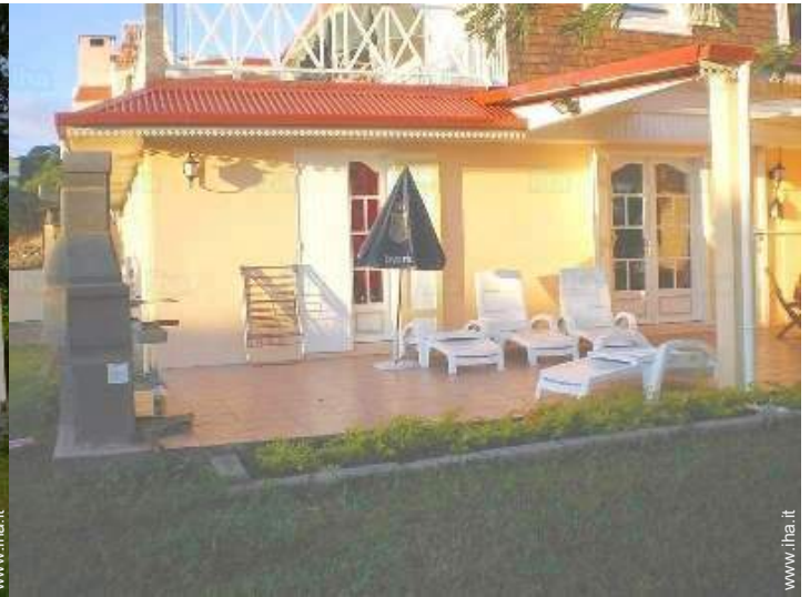
Attrezzature esterne a disposizione degli ospiti