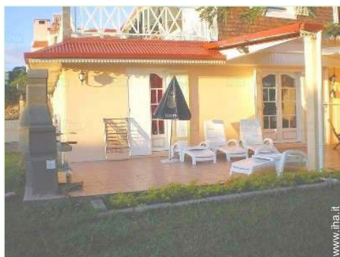
Attrezzature esterne a disposizione degli ospiti