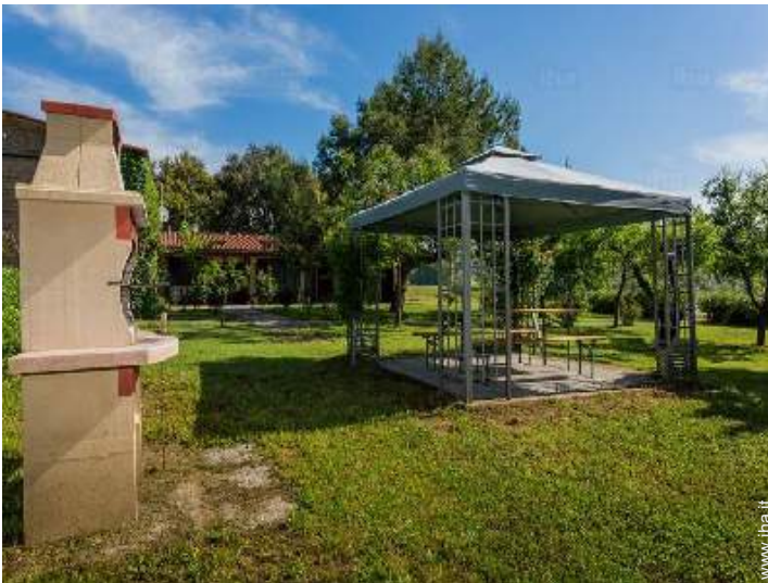
vista dal giardino/parco