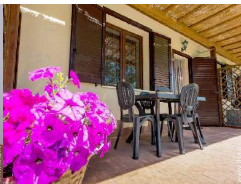
vista dalla veranda