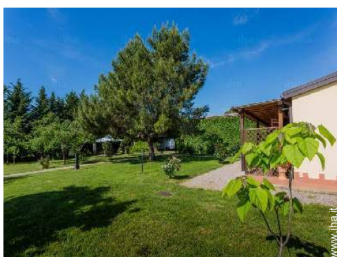
vista sul giardino/parco