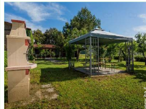
vista dal giardino/parco