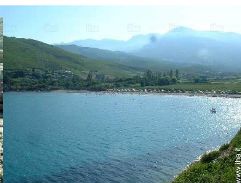
vista sul mare