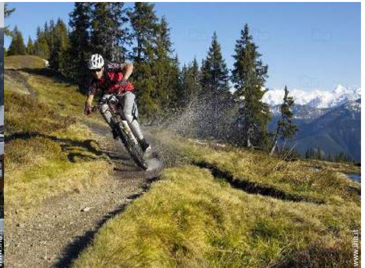
sport estivi nelle vicinanze