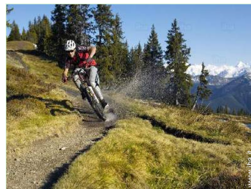
sport estivi nelle vicinanze

Negozi di alta classe e di lusso Salone di coiffure Internet café Ufficio postale Banca Distributore automatico di biglietti Farmacia Medico