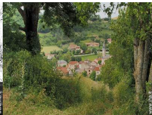
vista sul villaggio