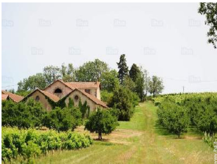
vista dalla proprietà