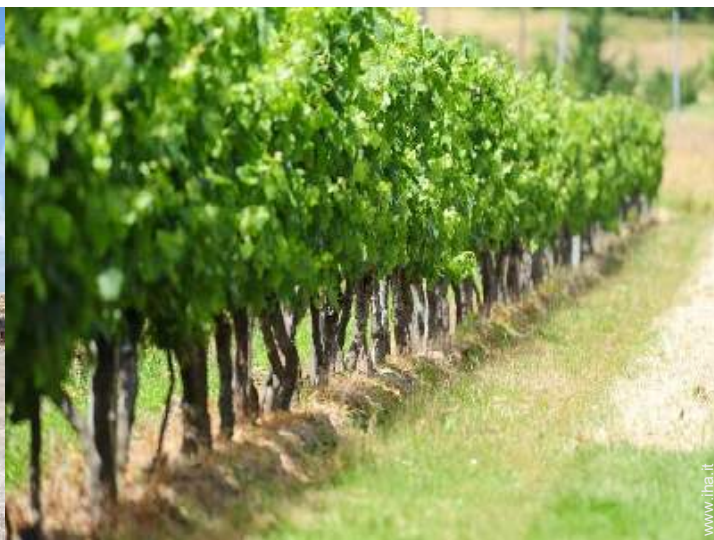
vista dalla proprietà