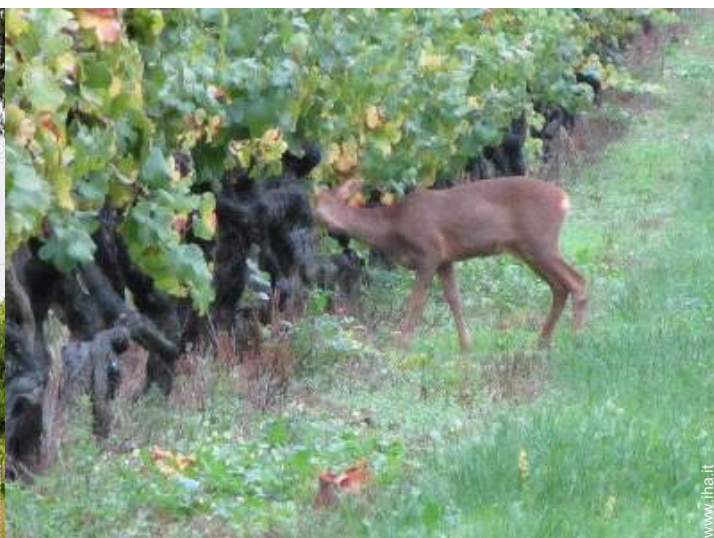
vista dalla proprietà