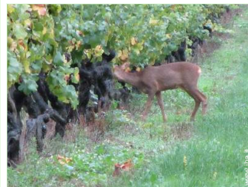
vista dalla proprietà

Villaggio centro 2km Centro città 10km Fermata/stazionamento bus 10km Noleggio auto 4km Panetteria 10km Negozi tipici 10km Supermercato 7,5km Negozi di alta classe e di lusso 7,5km Salone di coiffure 7,5km Internet café 7,5km Ufficio postale 7,5km Banca 7,5km Distributore automatico di biglietti 3km Farmacia 10km Medico 7,5km Ospedale 7,5km Ambulatorio 7,5km