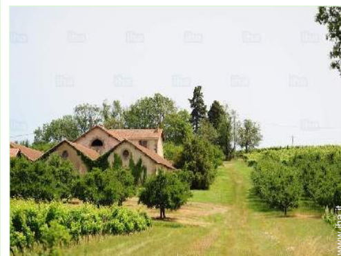
vista dalla proprietà