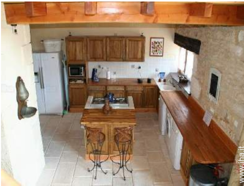
grande cucina in stile americano