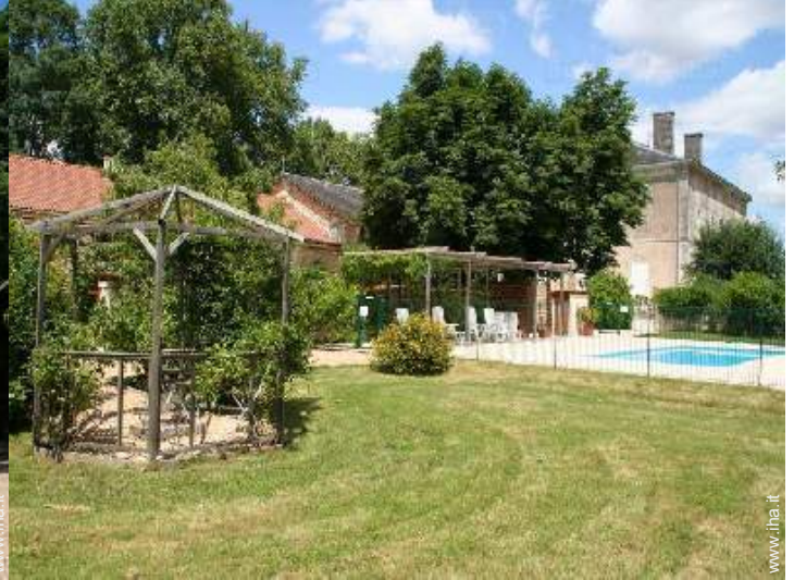
vista sulla piscina