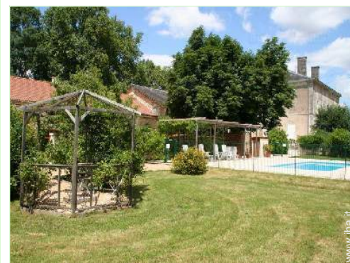
vista sulla piscina