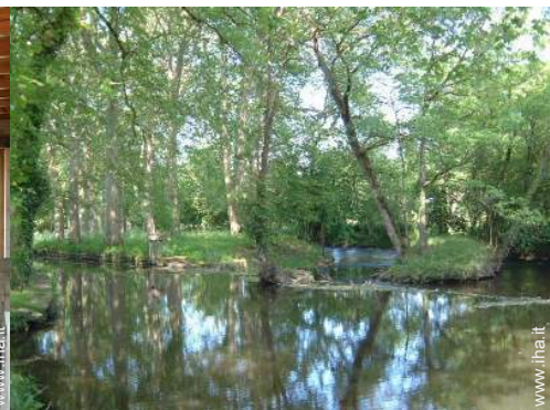
vista sul fiume