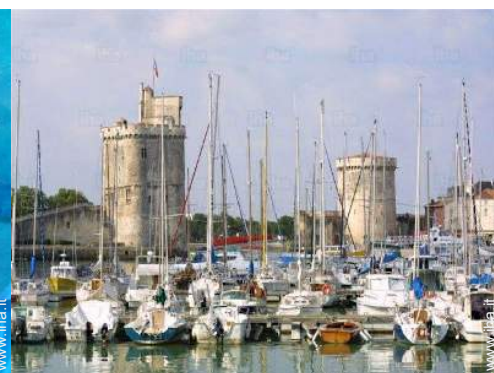
Città nelle vicinanze