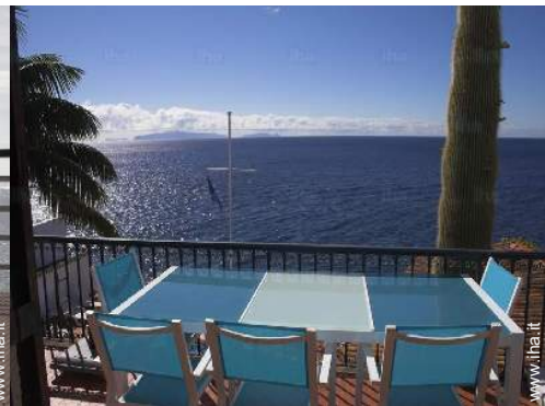
tavolo da giardino