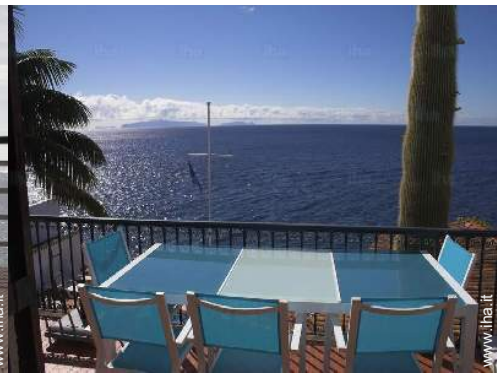
tavolo da giardino