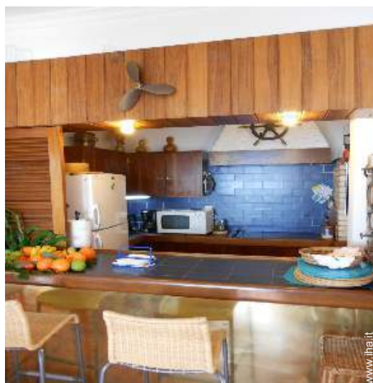
cucina in stile americano