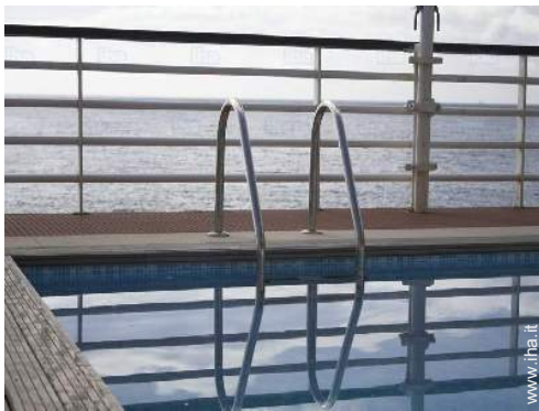
vista dalla piscina