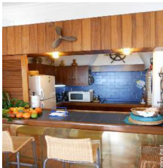
cucina in stile americano