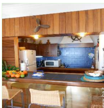
cucina in stile americano