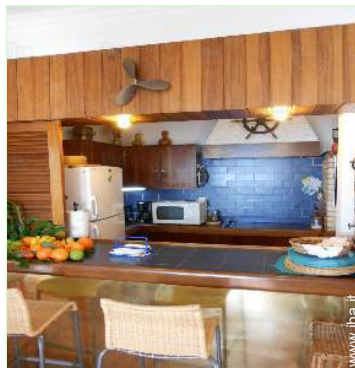
cucina in stile americano