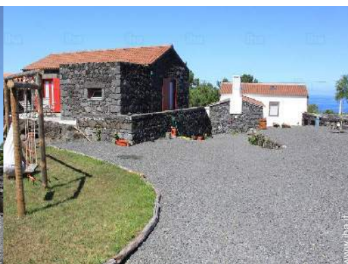
Ambito esterno a disposizione degli ospiti