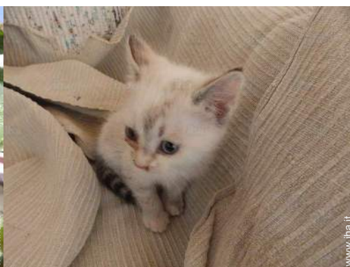
Gli animali domestici