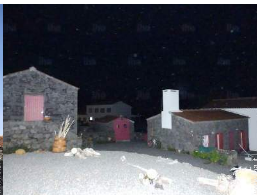
Ambito esterno a disposizione degli ospiti