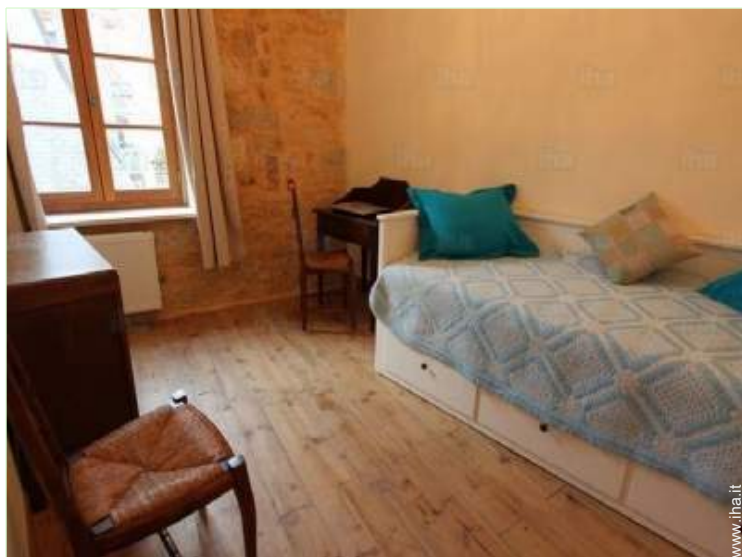
stanza degli ospiti