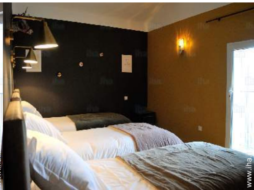
camera per ragazzi