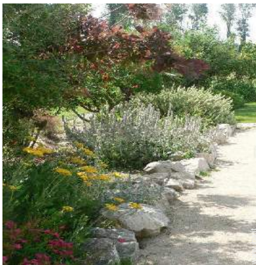
campo di bocce