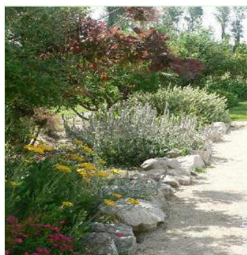
campo di bocce