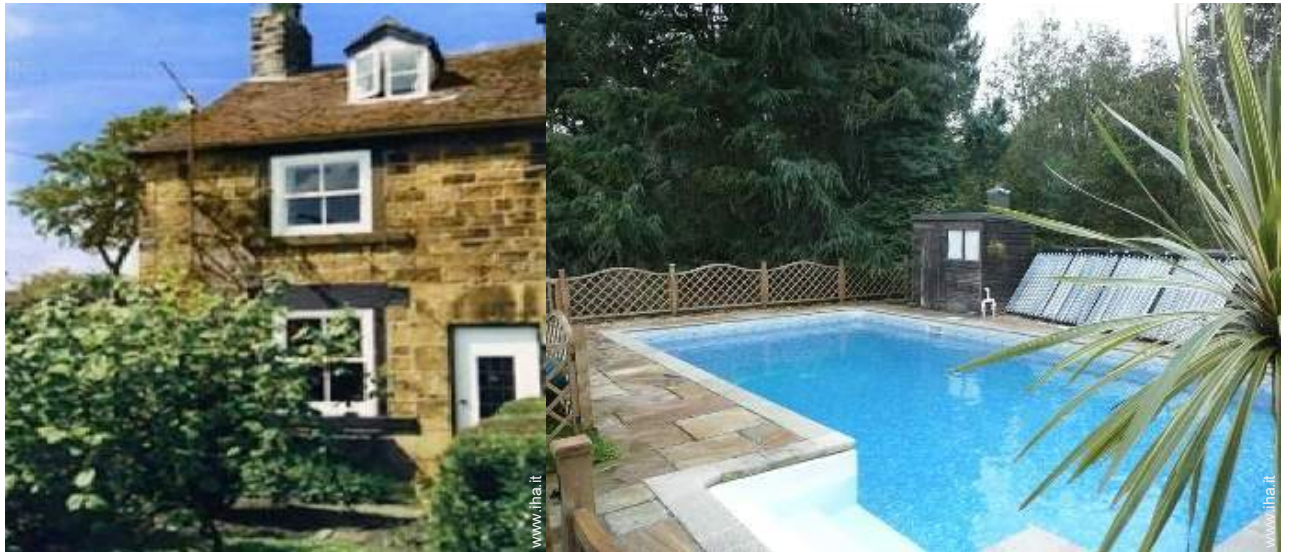
vista sulla piscina