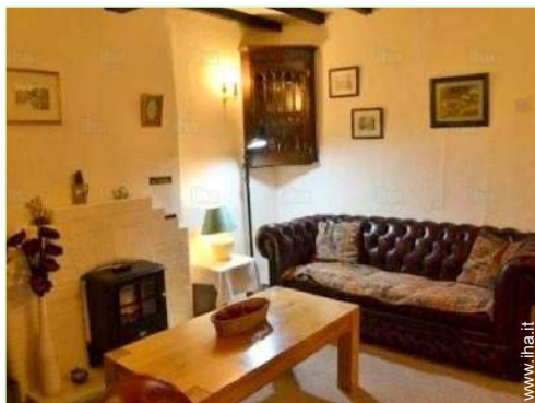
stanza di servizio