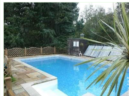
vista sulla piscina