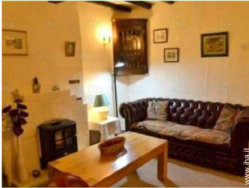
stanza di servizio