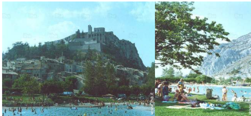
attrezzature ricreative nelle vicinanze