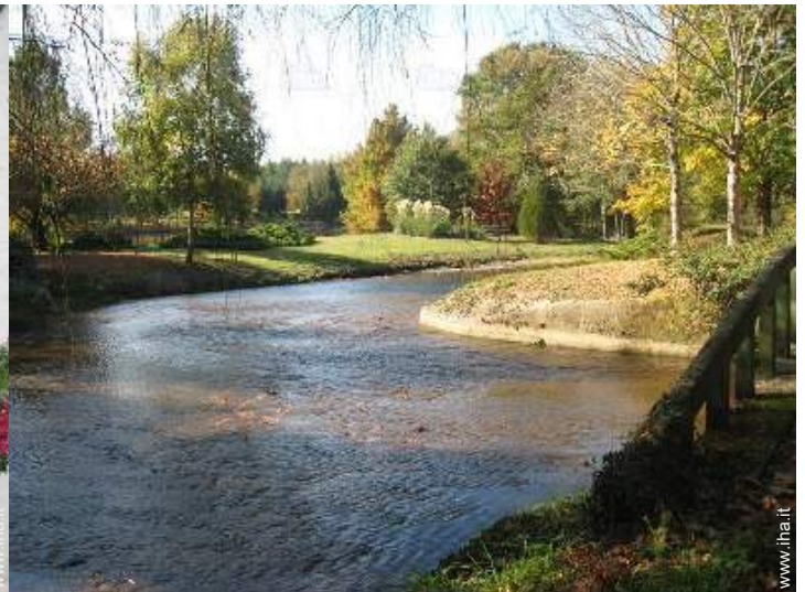
vista sul fiume