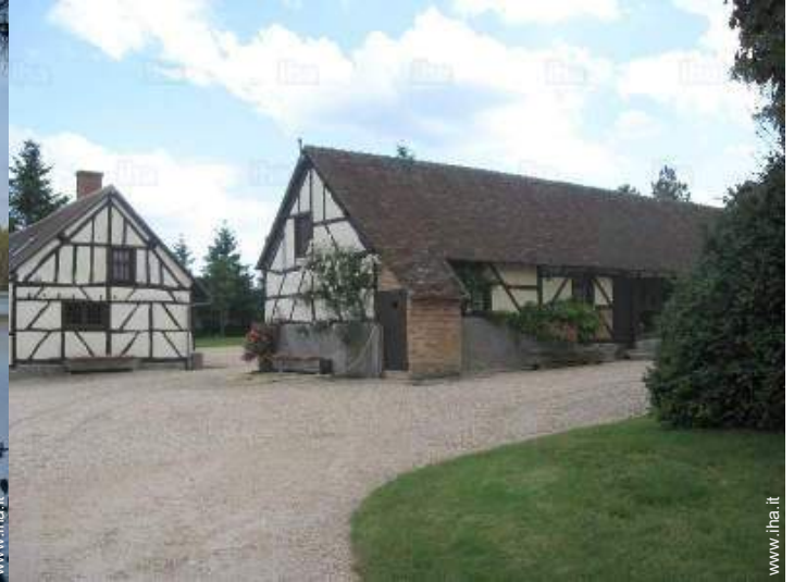
vista sul cortile