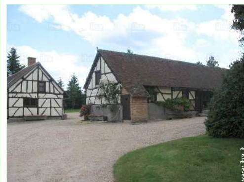
vista sul cortile