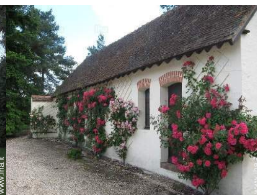
vista sul cortile