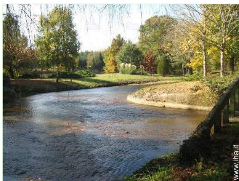
vista sul fiume