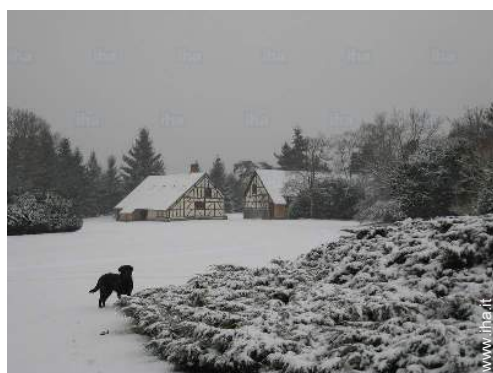
vista sul giardino/parco