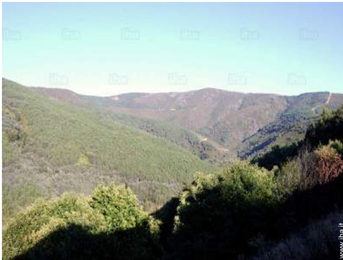
vista sulla montagna