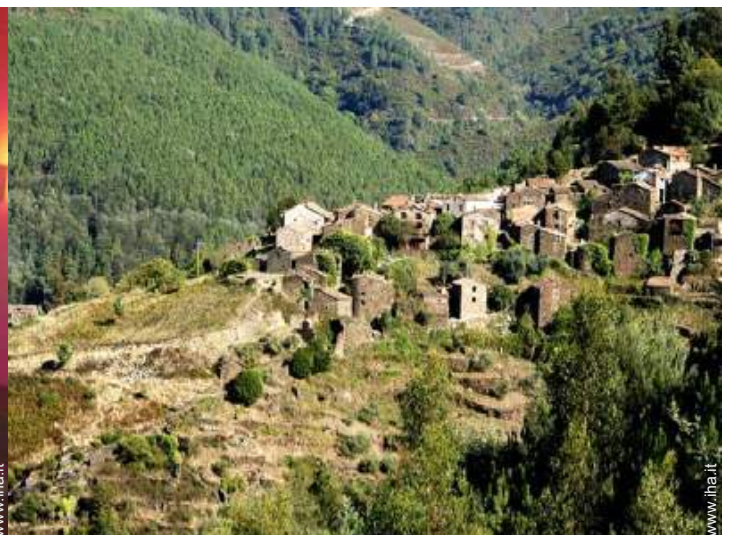
vista sul villaggio