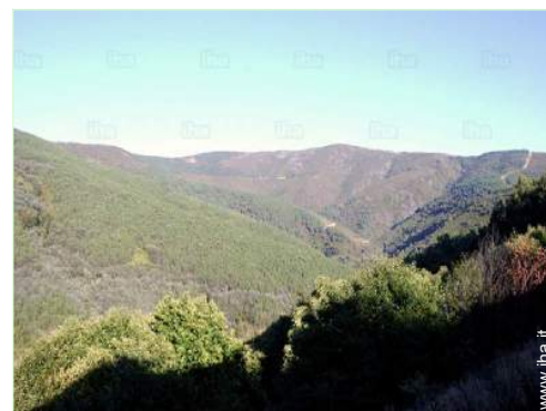
vista sulla montagna