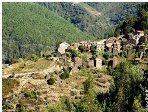
vista sul villaggio

Dotazioni per i diversamente abili : visiva, auditiva