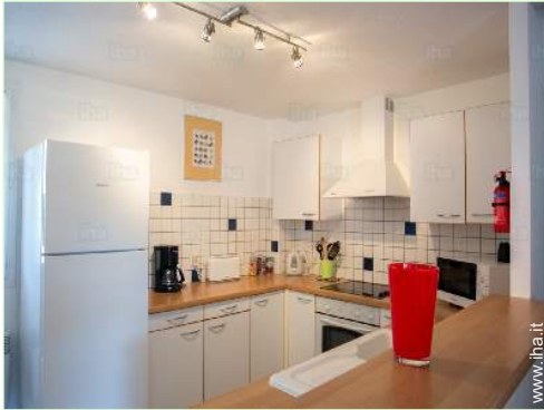
cucina in stile americano