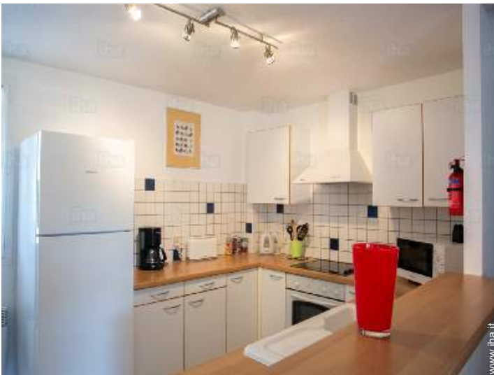
cucina in stile americano