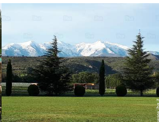
vista sulla montagna