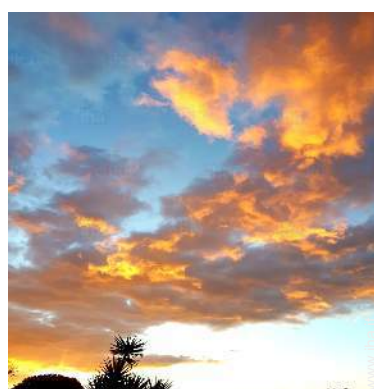
vista sul tramonto