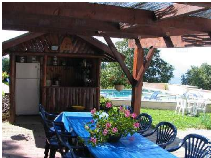
disposizione delle attrezzature ricreative