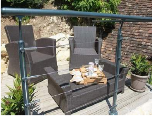
salotto da giardino