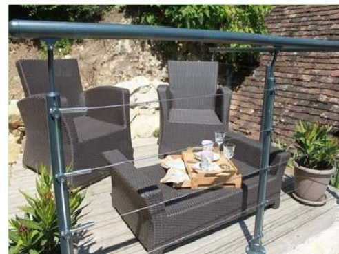
salotto da giardino

Salotto estivo, barbecue, tavolo da giardino, 4 sedia(e) da giardino, ombrellone, salotto da giardino, 2 sedia sdraio