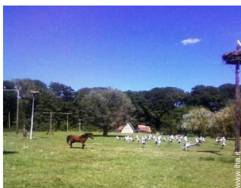
parco e giardino