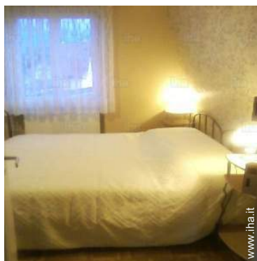
letti gemelli singoli