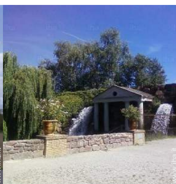
Attrazioni e relax