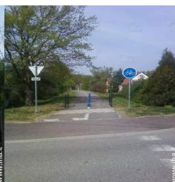
percorso per mountain bike