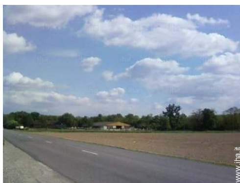
passeggiata a cavallo