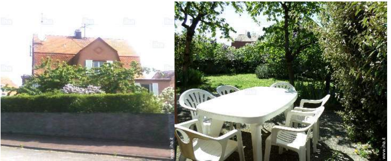
vista sul giardino/parco