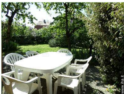
vista sul giardino/parco