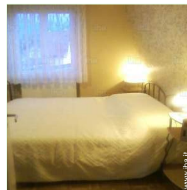
letti gemelli singoli

Salotto estivo, barbecue, tavolo da giardino, 8 sedia(e) da giardino, salotto da giardino