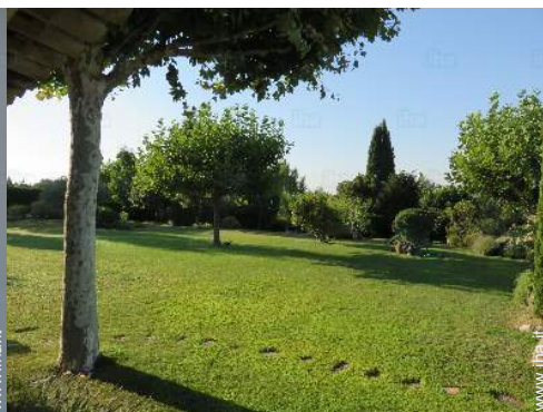
vista sul giardino/parco