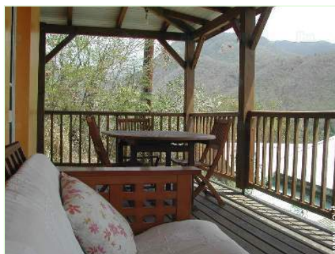
vista sulla montagna