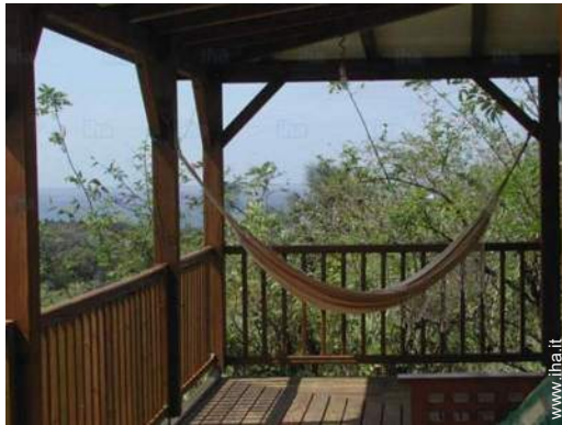
vista sul mare