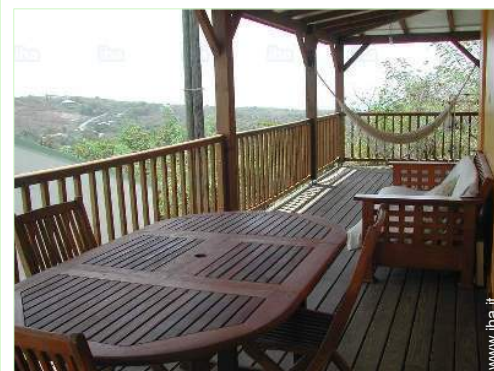
vista sul mare