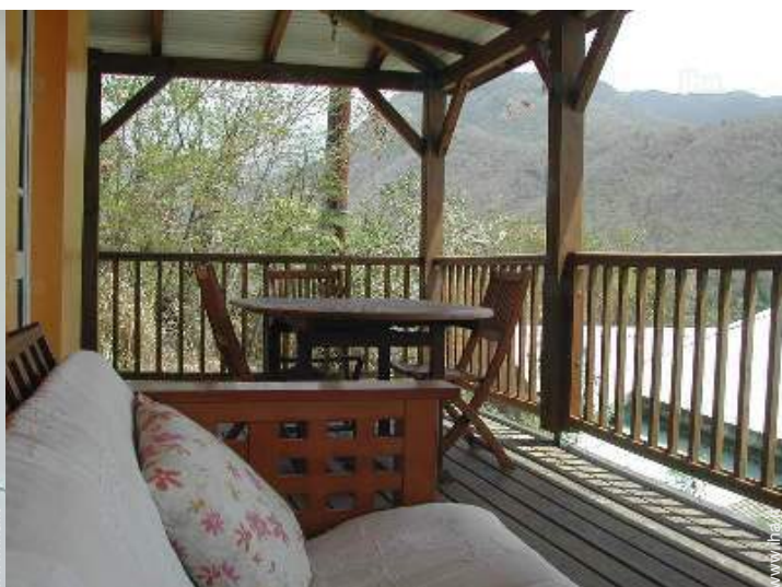
vista sulla montagna