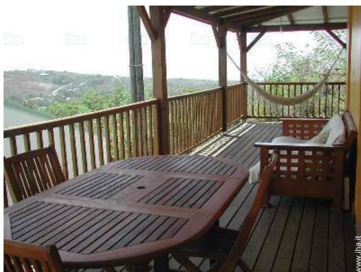
vista sul mare