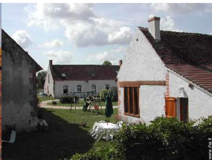
vista dal giardino/parco