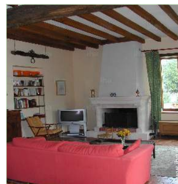
vista dal soggiorno