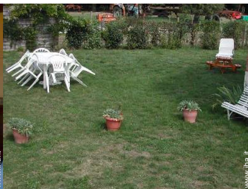
Attrezzature a disposizione