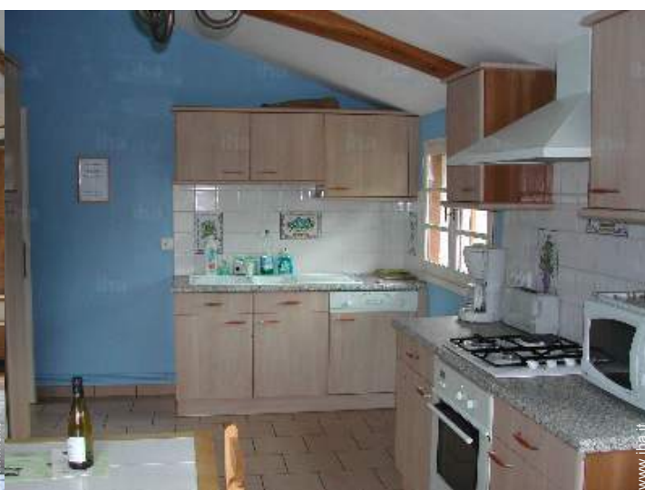
vista dalla cucina