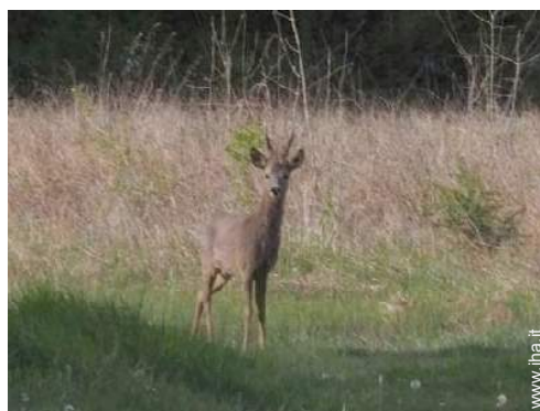
vista dal giardino/parco