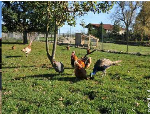
disposizione delle attrezzature ricreative