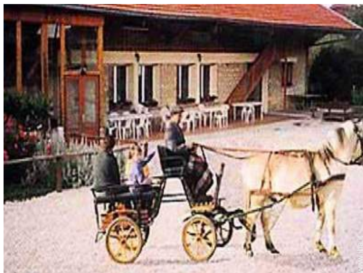
passeggiata a cavallo