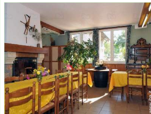
vista dalla sala da pranzo

Villaggio centro <50m Centro città 10km Fermata/stazionamento bus 10km Noleggio biciclette/mountain bike 10km Noleggio auto 10km Noleggio biancheria/lavanderia 10km Panetteria 10km Traiteur 10km Negozi tipici 10km Supermercato 10km Salone di coiffure 10km Ufficio postale 10km Banca 10km Distributore automatico di biglietti 10km Farmacia 10km Medico 10km Infermiera 10km Ospedale 10km