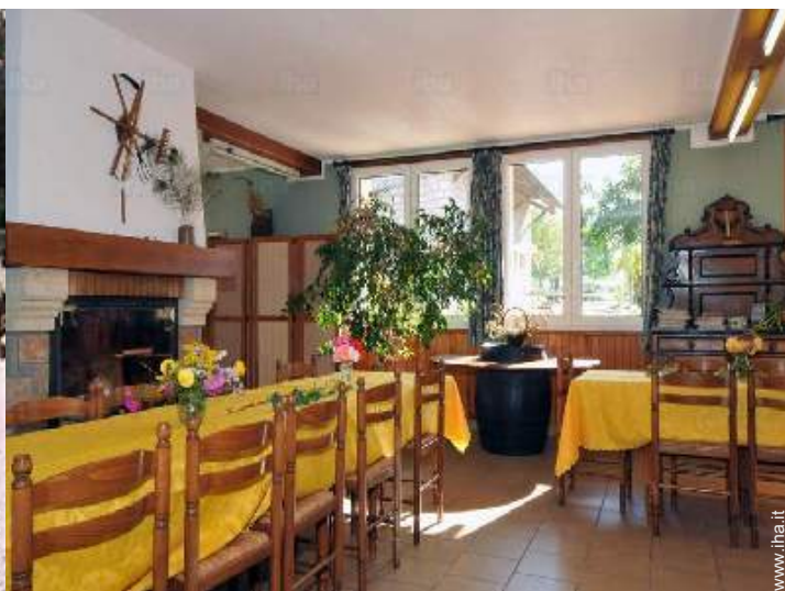
vista dalla sala da pranzo