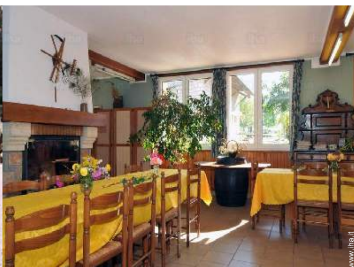
vista dalla sala da pranzo