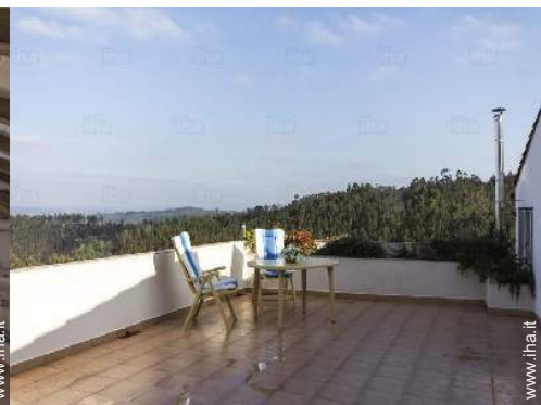
vista sulla foresta