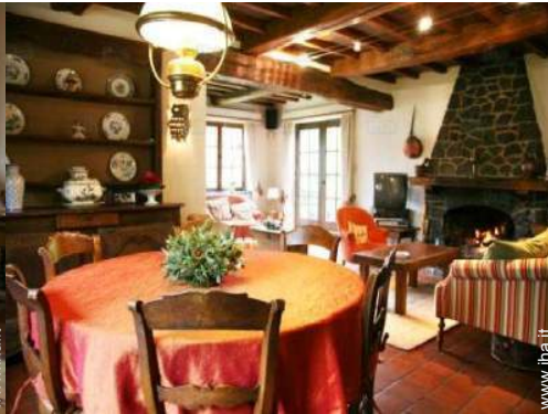
vista dalla sala da pranzo