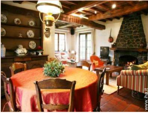
vista dalla sala da pranzo