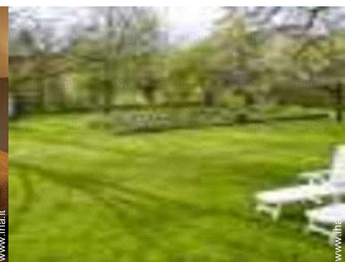
vista sul giardino/parco