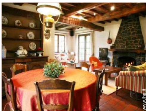
vista dalla sala da pranzo