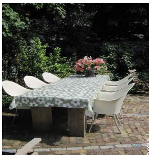
tavolo da giardino