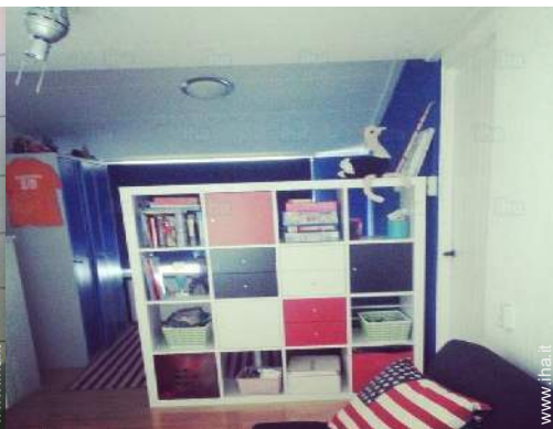
divano(i) letto 1 pers