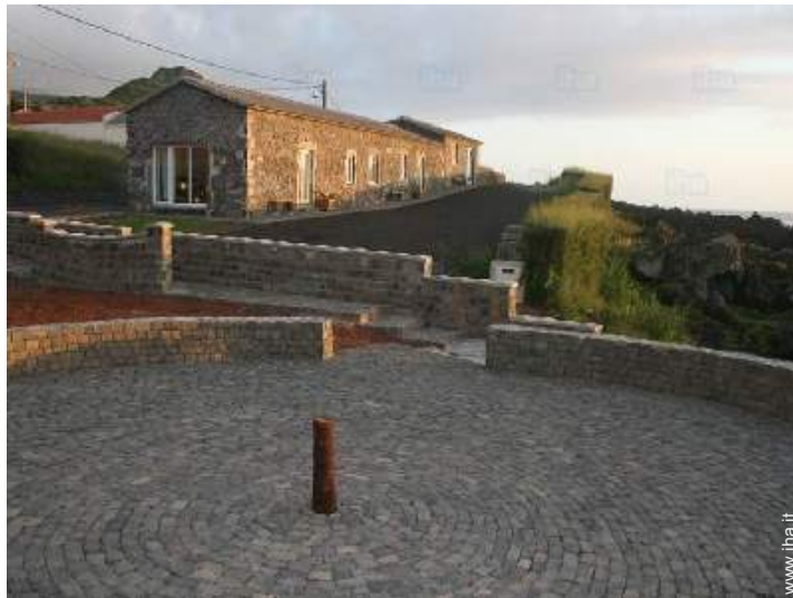
Casa in Pietra di Charme