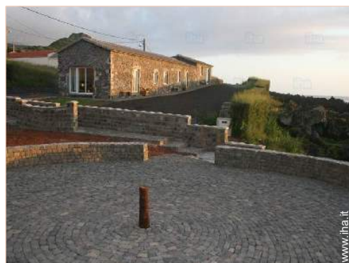
Casa in Pietra di Charme

Privilegi : Accesso diretto alla spiaggia