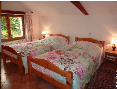
camera dei bambini