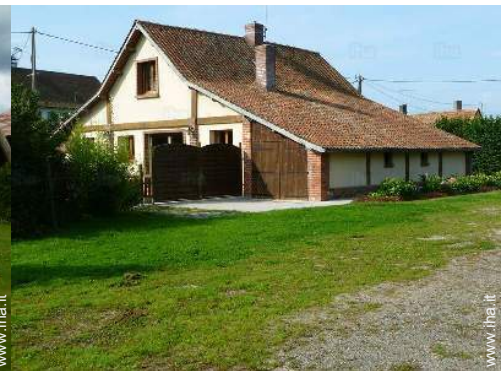
Casa di Campagna di Charme