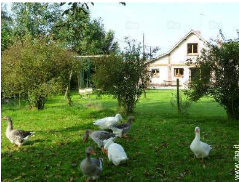
vista sul giardino/parco