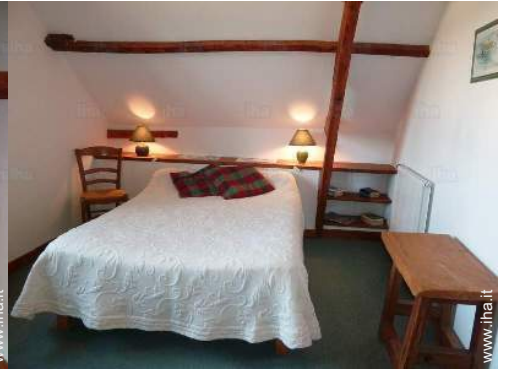
stanza degli ospiti