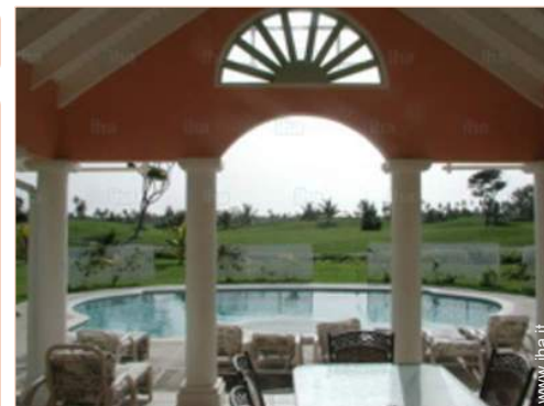
vista dal patio

Barbecue a gas, tavolo da giardino, 8 sedia (e) da giardino, 8 chaise(s) longue(s)