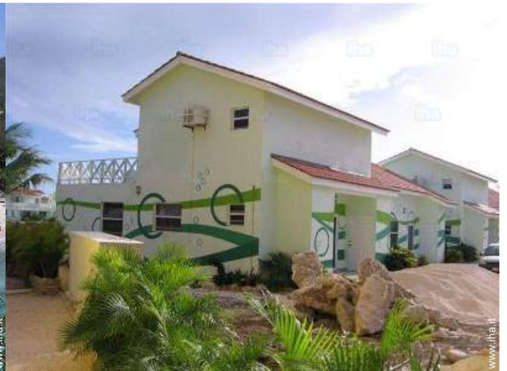
Residenza di Charme