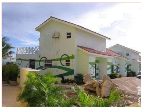
Residenza di Charme