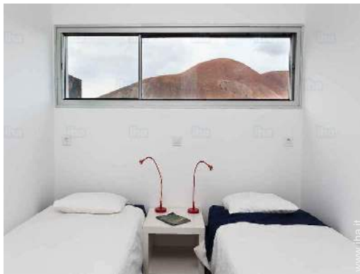
camera per ragazzi