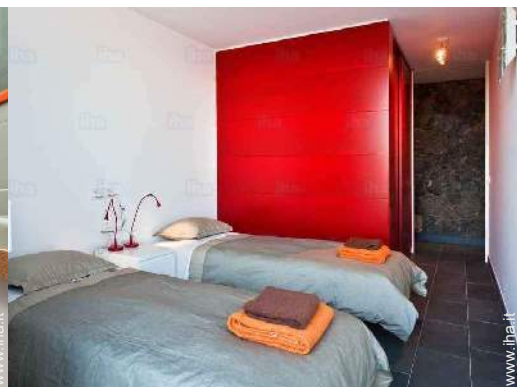
camera per ragazzi