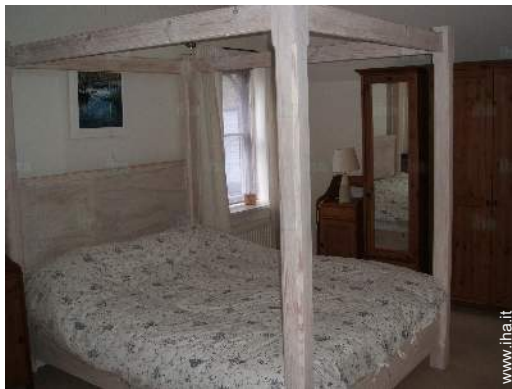
letto(i) matrimoniale(i) a baldacchino