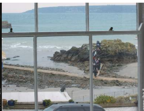
vista dalla casa