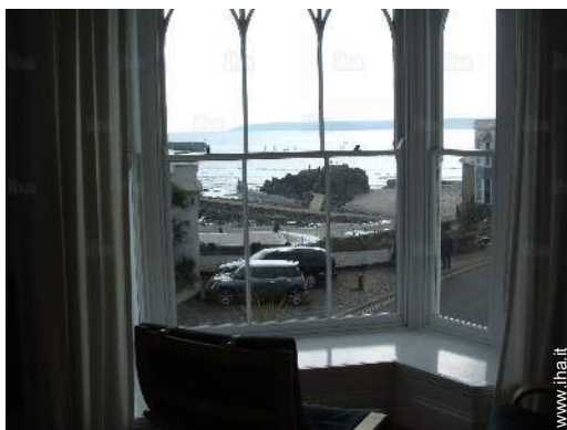
vista dal soggiorno