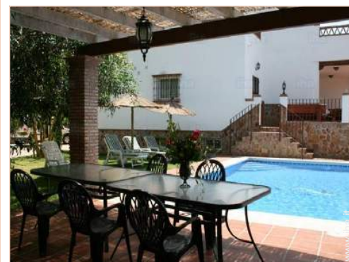
salotto da giardino