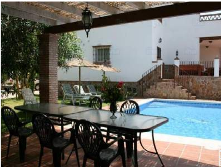
salotto da giardino