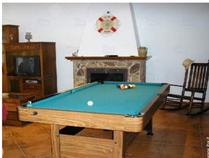
tavolo da biliardo