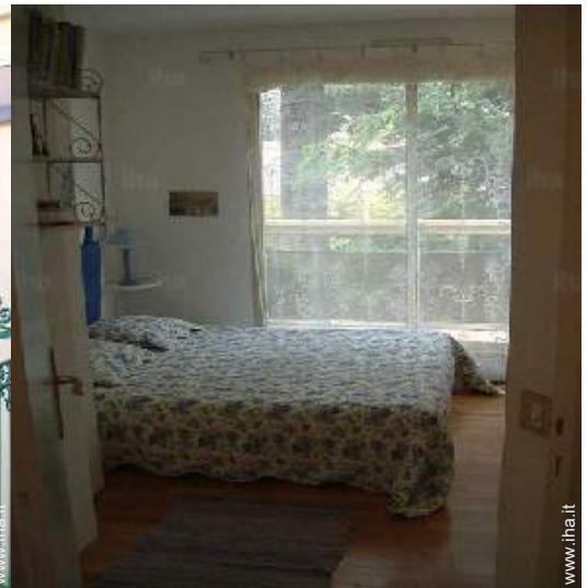
camera del proprietario