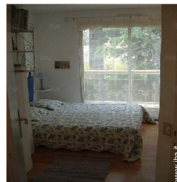
camera del proprietario

Negozi di alta classe e di lusso 3km Salone di coiffure 200m Internet café 800m Ufficio postale 500m Banca 500m Farmacia 500m Medico 800m Ospedale 1km