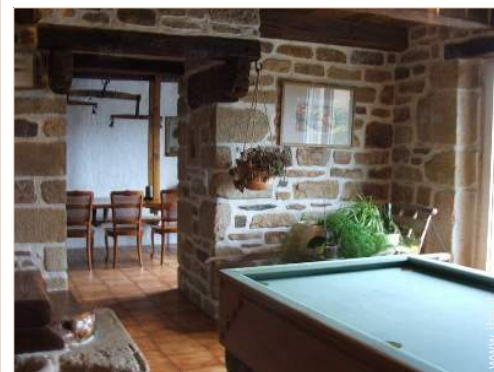
tavolo da biliardo

Villaggio centro 3km Centro città 5km Panetteria 5km Traiteur 5km Negozi tipici 5km Supermercato 5km Negozi di alta classe e di lusso 20km Salone di coiffure 5km Internet café 20km Ufficio postale 5km Banca 5km Distributore automatico di biglietti 5km Farmacia 5km Medico 5km Infermiera 200m Ospedale 10km