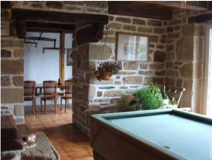
tavolo da biliardo