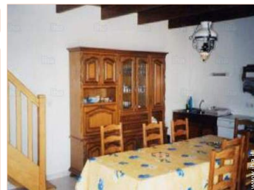
vista dalla sala da pranzo