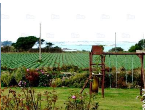
vista dal giardino/parco