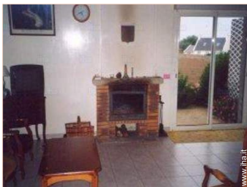
vista dal salone