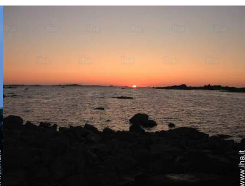
vista sul tramonto