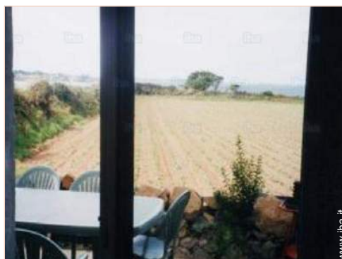
vista dal terrazzo