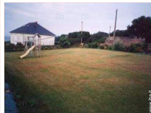
vista dal giardino/parco

Piscina riscaldata 10km Mare/oceano 300m Spiaggia 300m Spiaggia con ciottoli 300m Spiaggia rocciosa 300m Piscina pubblica 10km Campo da tennis pubblico 15km Percorso di golf 9 buche 30km Percorso di golf 18 buche 30km Centro nautico 10km Scogliera 15km Fiume 10km Foresta 10km Marina 10km Scalo di alaggio per la barca 300m