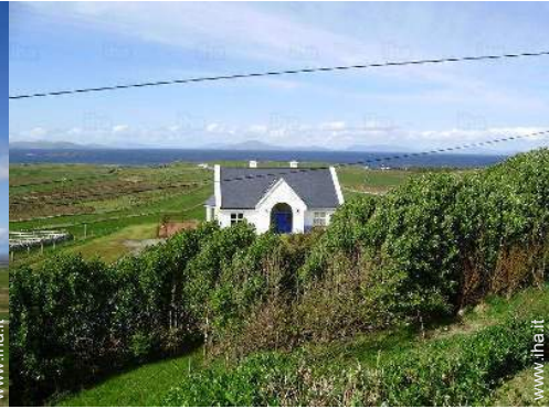
vista sul mare