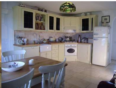
grande cucina indipendente