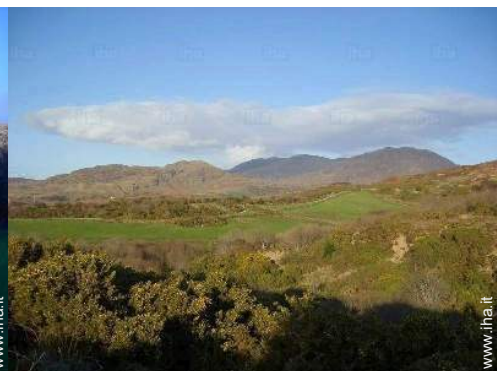
attività montane nelle vicinanze