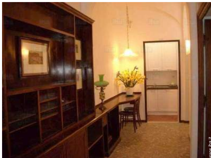
Disposizione interna e comfort