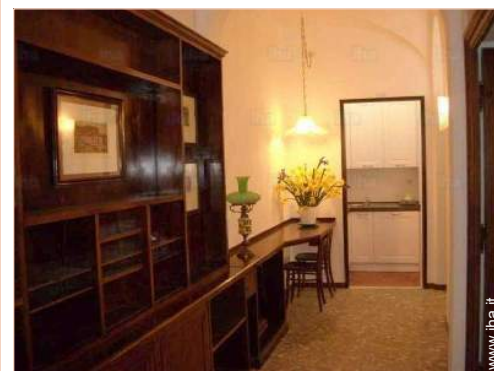
Disposizione interna e comfort