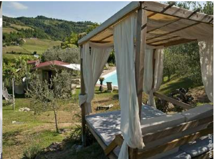
disposizione delle attrezzature ricreative