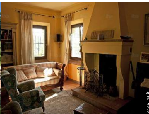
Comfort interno ed attrezzature