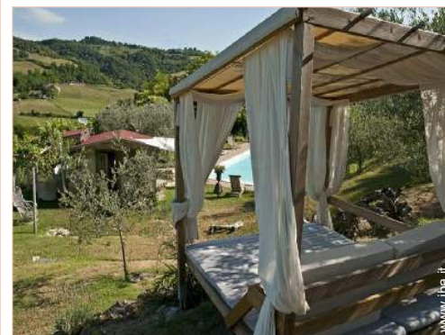
disposizione delle attrezzature ricreative