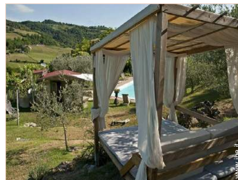
disposizione delle attrezzature ricreative

Spiaggia 20km Campo da tennis pubblico 10km Percorso di golf 18 buche 25km Lago 4km