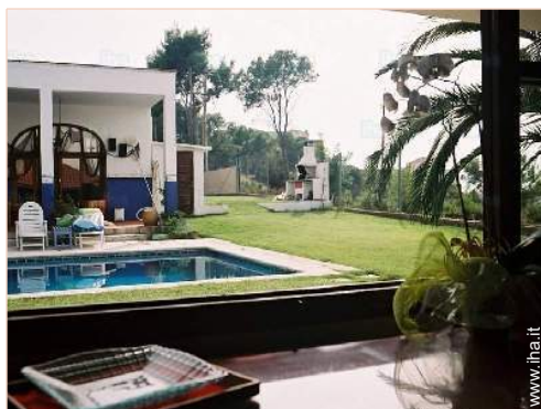
vista dalla sala da pranzo