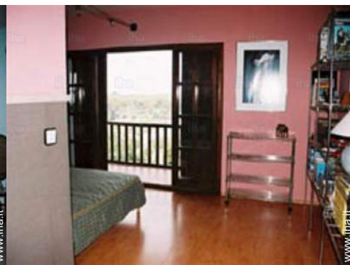
stanza degli ospiti