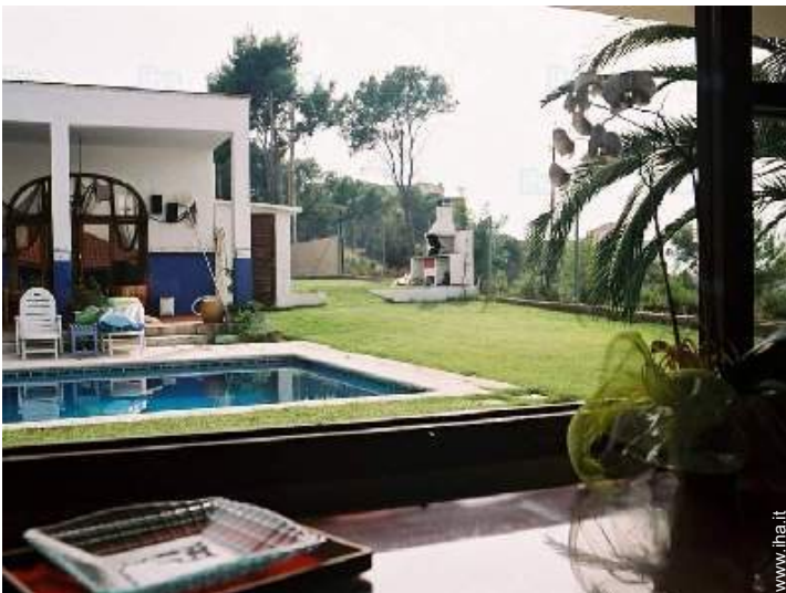
vista dalla sala da pranzo