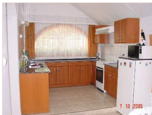
grande cucina in stile americano