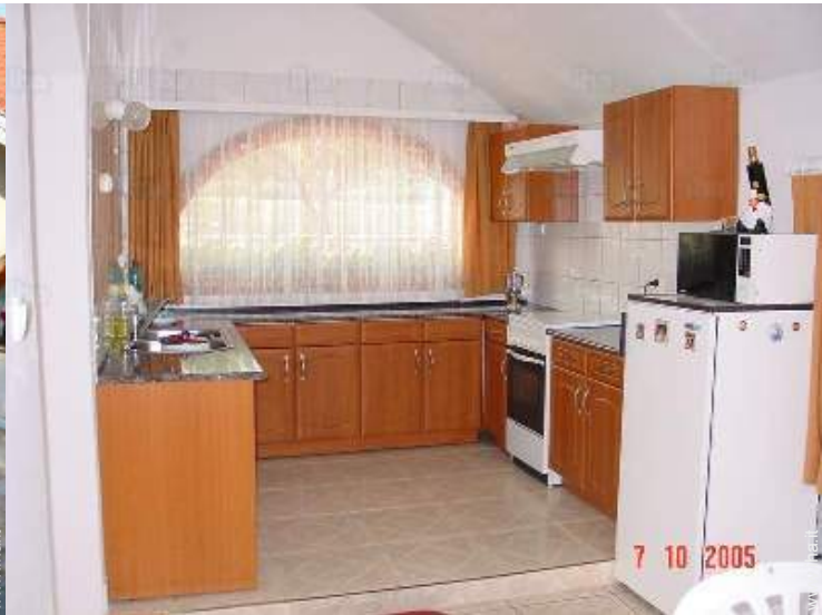
grande cucina in stile americano