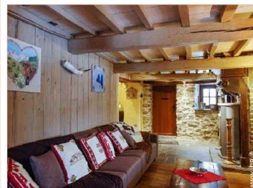
salone con televisore