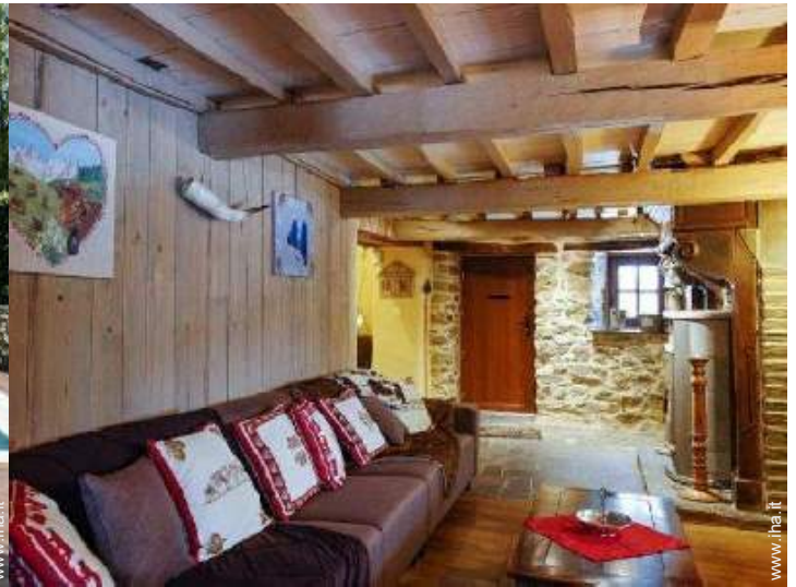
salone con televisore