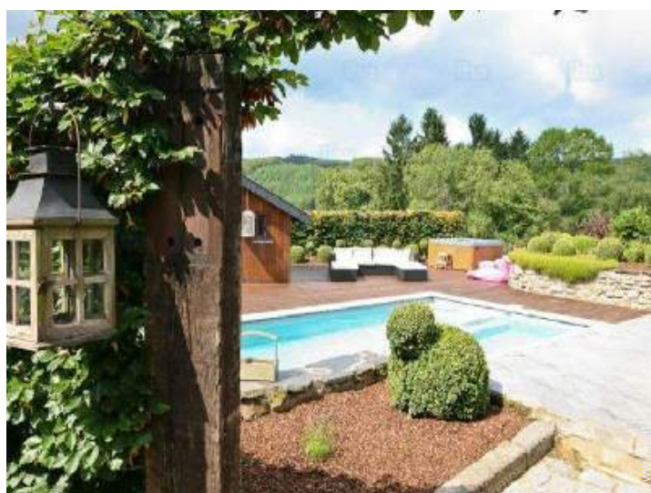
vista sulla piscina