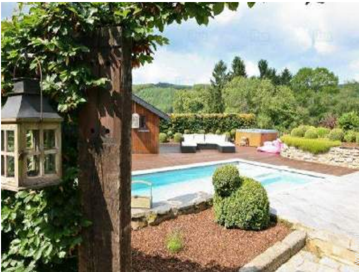
vista sulla piscina