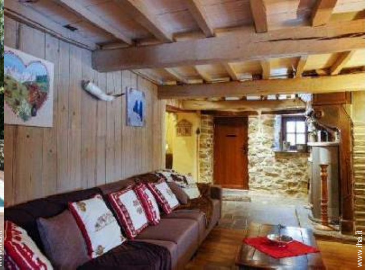
salone con televisore